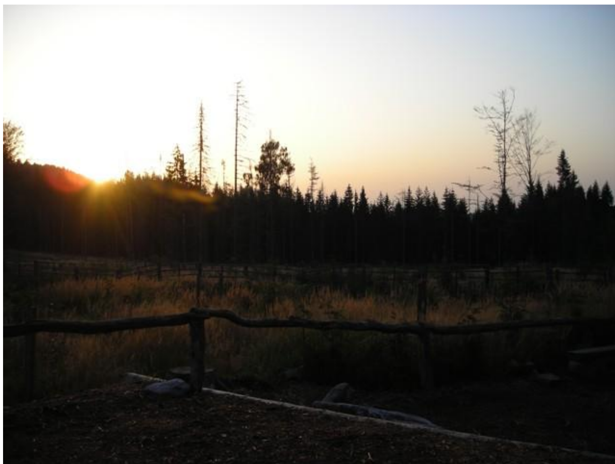
Ráno pod Plešným jezerem

Probouzí mne až ranní zpěv ptáčků. Vykouknu ze stanu právě v okamžiku východu sluníčka. Je to úžasná atmosféra, která se musí prožít. Žádná fotografie ji nemůže řádně znázornit.