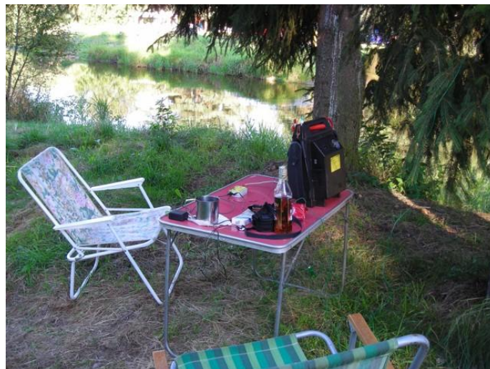
Rezervní zdroj 12V/17Ah

Rezervní zdroj 12V/17Ah obsahuje v sobě i světlo a kompresor pro nafukování pneumatik. Velice praktické je měření výstupního napětí, které mimo jiné obsahuje stupnici barevně označující v procentech úroveň vybití (nabití). Pokud jedete na expedici autem, je to vynikající věc. Přitom je tento zdroj vybaven i kabelem pro připojení k autobaterii a tedy má možnost se (většinou při jízdě kdy napětí na autobaterii dosahuje hodnot kolem 14.4 V) dobíjet. Je to velice praktická věc