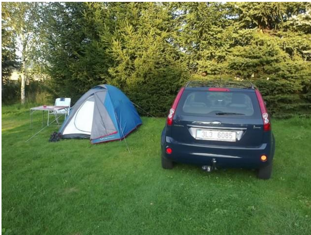
Ubytování v kempu Nýrsko