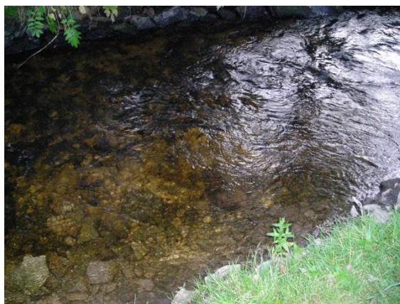
Vltava na Zahrádkách